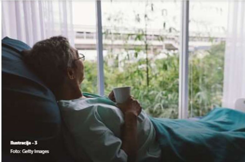
Ilustracija - 3